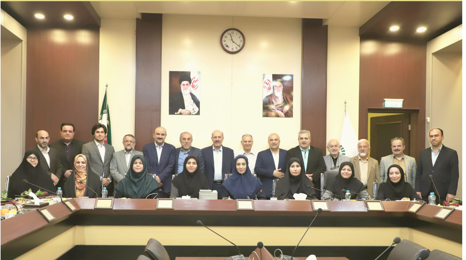
تقدیر از اعضای پنج دوره شورای اسلامی شهر قزوین به مناسبت روز شوراها

این راهی است که باید شورای اسلامی شهر هم طی کند که بیست سال از زادروزش می‌گذرد و اگر هنوز وظایف قانونی‌اش در کاغذ با اجرا